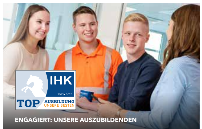
ENGAGIERT: UNSERE AUSZUBILDENDEN