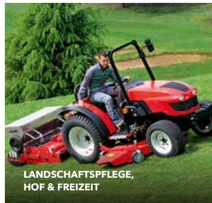
LANDSCHAFTSPFLEGE, HOF & FREIZEIT

Als Großhändler setzen wir zu 100 Prozent auf Fachhandel und Hersteller. Mit unseren Experten unterstützen wir Sie bei der Flotten- und Anwenderberatung sowie bei der Entwicklung von Spezial- und Sonderlösungen in der Erstausrüstung.