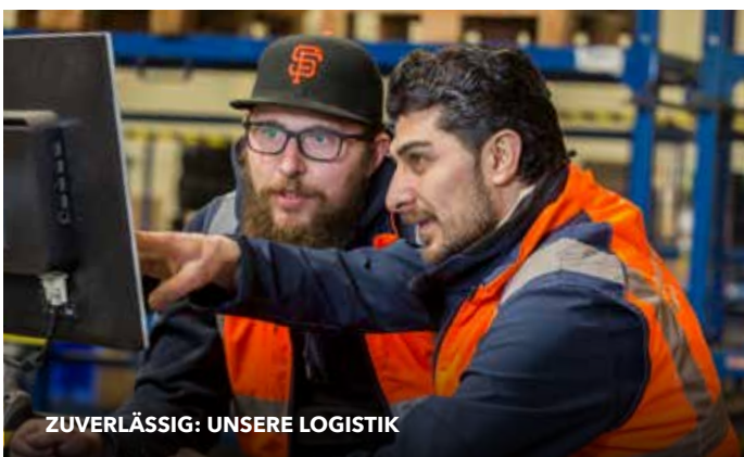
ZUVERLÄSSIG: UNSERE LOGISTIK