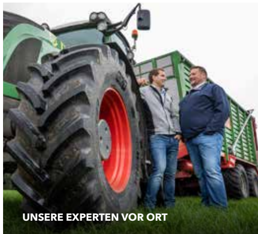
UNSERE EXPERTEN VOR ORT