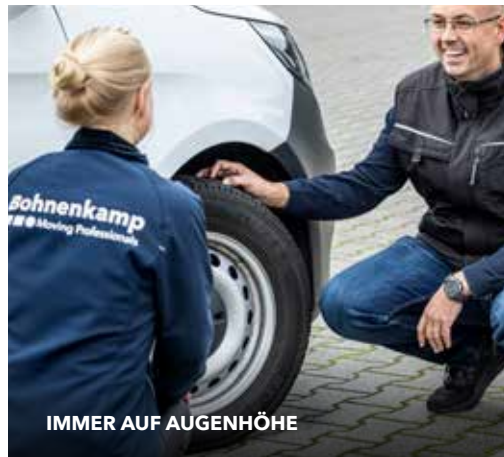
IMMER AUF AUGENHÖHE