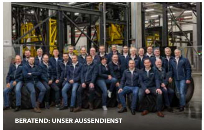
BERATEND: UNSER AUSSIEDIENST