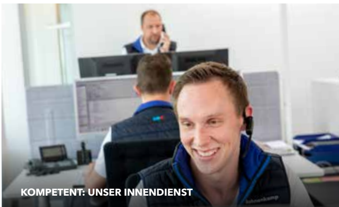
KOMPETENT: UNSER INNEDIENST

Unterstützt werden unsere Experten durch unseren Online-Shop und unsere App, über die der Handel rund um die Uhr Zugriff auf das gesamte Sortiment und auf alle technischen Daten hat.