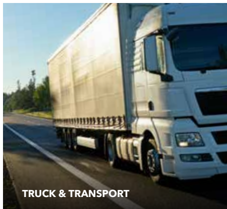
TRUCK & TRANSPORT